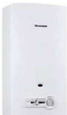
WR - piezo

Pri WRD modelih lahko na vgrajenem LCD zaslonu takoj vidite vse potrebne podatke – od uporabniškega menija do temperature iztočne vode. Če povzamemo – pretočni grelniki vode Junkers MiniMaxx vam ponujajo vrhunsko tehnologijo v kompaktni izvedbi. Vsekakor pa je seveda samoumevno, da pretočni grelniki Junkers ustrezajo vsem varnostnim predpisom.